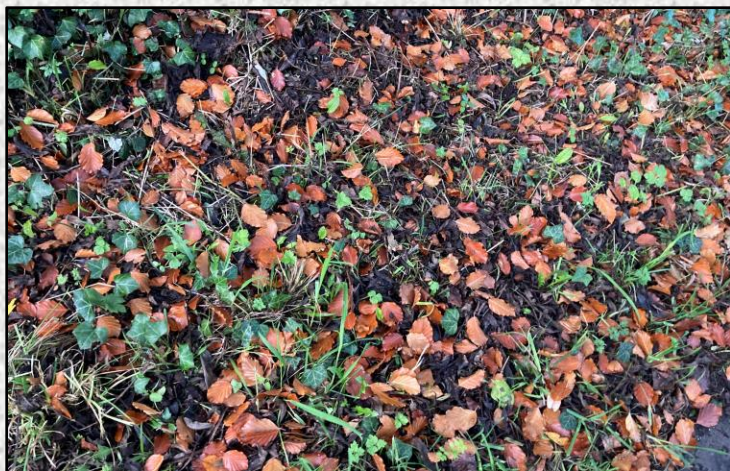
Cruinníonn bruscar duille ag an am seo den bhliain. De réir mar a lobbann sé, tabharfaidh sé cothaitheigh luachmhara ar ais san ithir le haghaidh fás na bliana seo chugainn.