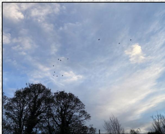
Sna tráthnónta, bí ag breathnú ar an spéir d'ealtaí de charóga (is iad na cága & rúcaigh is coitianta) agus iad ar an mbealach chuig a láithreacha fara geimhridh