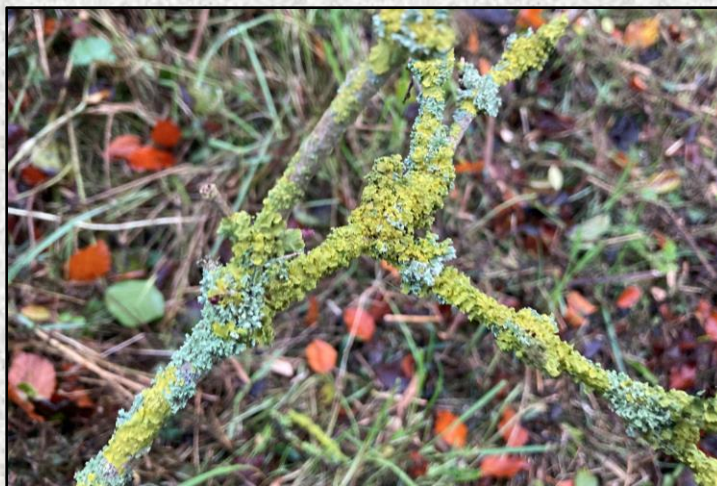
Féach ar choirt lom na stoc crainn, ar ghéaga agus craobhóga, chun na léicin a aimsiú