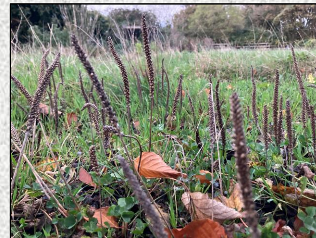
Tá na cinn síolta ó roinnt plandaí atá faoi bhláth ina laethanta deiridh anois agus a gcuid síolta ag titim, m.sh., an Cuach Phádraig