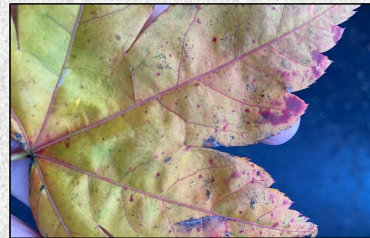
Breathnaigh go dlúth ar dhuilleoga tite; b'fhéidir go spreagfadh na dathanna, na patrúin agus na cruthanna ealaíontacht!