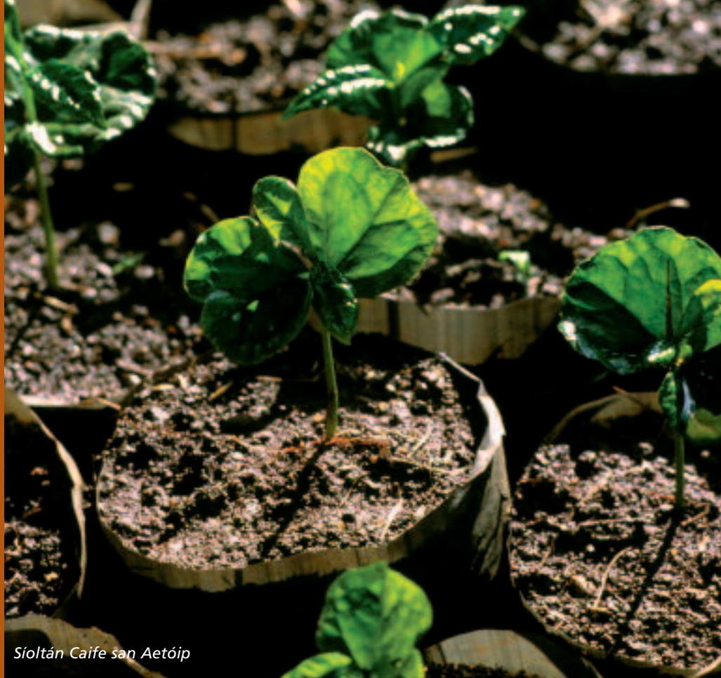
Síoltán Caife san Aetóip