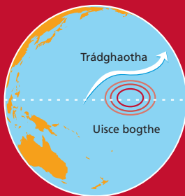
Bliain El Nino

B'í cuairt El Nino i 1997-98 an tarlúint ba dhífobhálaí fós, mar ba í ba chúis le (i measc rudaí eile) tuilte agus maidhmeanna talún in iarthuaisceart Mheiriceá Theas, stoirmeacha i gCalaifórnía, triomach i ndeisceart na hAfraice, teip an mhonsúin i bhforaoiseacha báistí oirdheisceart na hÁise. Meastar costas an damáiste a deineadh d'ábhar maoine amháin a bheith suas le U.S $33 bhillún. Mar a léirigh an tubaiste ba mheasa roimhe sin i 1982-83, tá an costas ó thaobh na tráchtála de ollmhór agus leathadach.